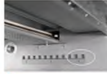
3 Attract tray chamber

VS 1.0-1.2mm (The thicker the better for baking uniform, better baking effect with net)