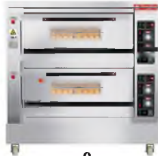
HLY-204 (Gas 2-Deck 4-Tray)