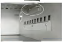
5 4-Direction adjustable burner flaps

VS Thermally stable plate, does not meet food safety standards