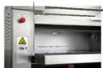
6 Electrical parts warranty > 2 years