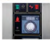
2 400 degree digital display thermostat

VS Fixed firing plate, use 1 adjust to suit for different bread