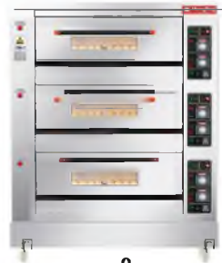
HLY-306 (Gas 3-Deck 6-Tray)