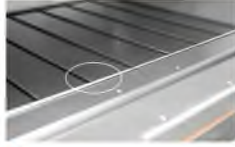
4 Exact 1.85mm bottom plate with baking net

VS Iron burner easy to get rust and stuck