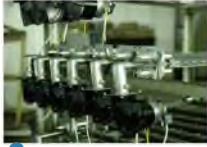
1 Stainless steel burner warranty 6 years

VS Iron burner easy to get rust and stuck